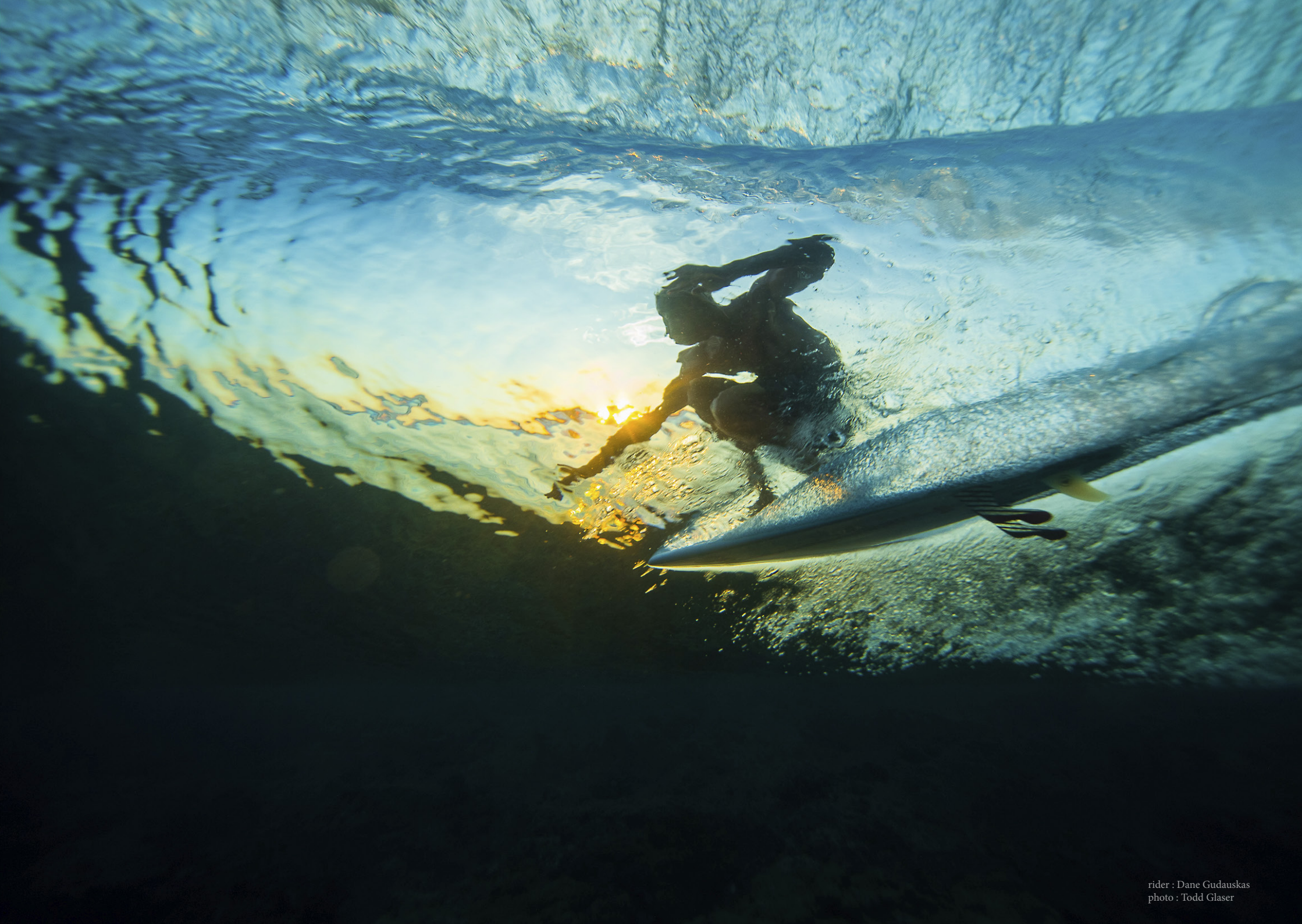
rider : Dane Gudauskas