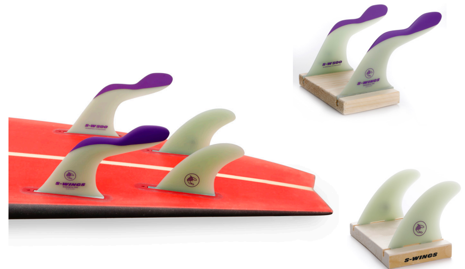
Rear Quad G10